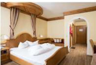
DOPPELZIMMER MAGDALENA ca. 25 m 2 / 2-4 Personen Doppelzimmer mit Bad oder Dusche/WC, WC teilweise getrennt