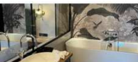
WELLNESSUITE MAGDALENA ca. 55 m 2 , mit Privatsauna für 2-4 Personen