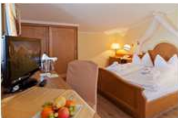
DOPPELZIMMER ZILLERTAL ca. 20 m 2 / 1-2 Personen Einzel- & Doppelzimmer mit Bad oder Dusche oder Bad/WC