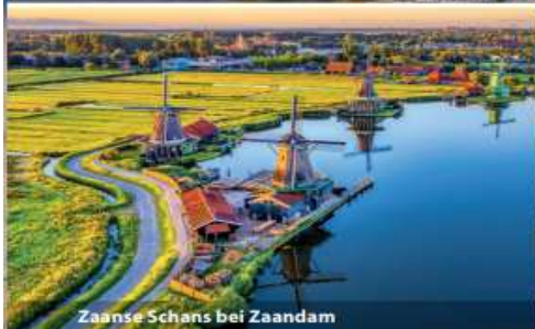
Zaanse Schans bei Zaandam