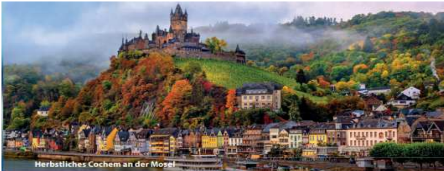
Herbstliches Cochem an der Mosel